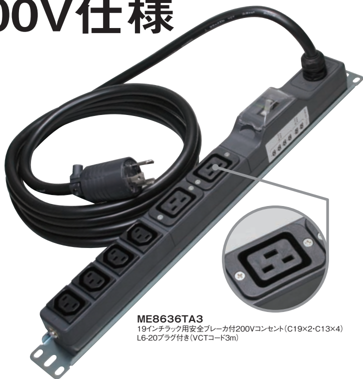
ME8636TA3 19インチラック用安全ブレーカ付200Vコンセント(C19×2・C13×4) L6-20プラグ付き(VCTコード3m)

最近のデータセンターで使用される機器は高性能が進み、必要電源が100Vから200Vに変わって来ています。特に、高密度なブレード・サーバなどは200V仕様のものが主流であり、海外ベンダーが提供する機器も基本的に200V電源が前提になっております。データセンターのエネルギー効率を上げ、省電力化を図る目的で近年200Vの電源を分岐するコンセントの需要が高まってきました。そこでお客様のご要望にお答えすべく開発したのがこの19インチラック用ブレーカ搭載形200V接地コンセントです。