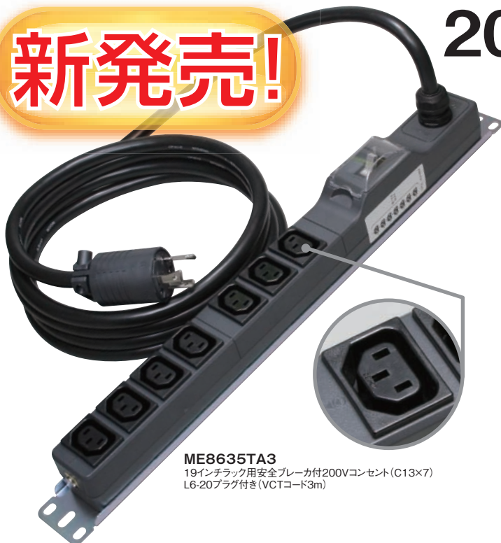
ME8635TA3 19インチラック用安全ブレーカ付200Vコンセント(C13×7) L6-20プラグ付き(VCTコード3m)